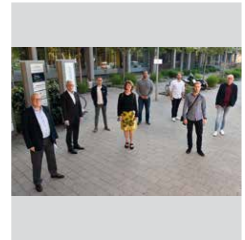
Austausch mit Bündnis 90 - Die Grünen in Hannover.

bis zu sieben Millionen Euro im Rahmen des zweiten Nachtrags zum Haushaltsplan 2020 für ein Corona-Sonderprogramm für Sportorganisationen bereitzustellen. Der Niedersächsische Landtag hat den zweiten Nachtrag am 15. Juli beschlossen. Die Umsetzung erfolgte im Rahmen der „Richtlinie“ über die Gewährung von Billigkeitsleistungen zur Unterstützung aufgrund von der COVID-19-Pandemie in ihrer Existenz bedrohten gemeinnützigen Sportorganisationen mit einem Antragsformular im LSB-Intranet.