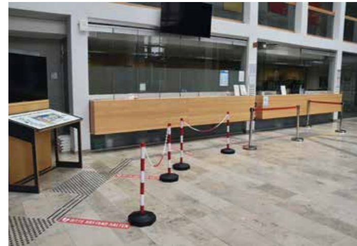
Auch am Empfang der Akademie des Sports am Standort Hannover machen sich die Maßnahmen bemerkbar.

Im Berichtszeitraum bot das Programmteam über 40 Veranstaltungen aus den Formaten Akademie-Gespräch, Akademie-Forum und „Kompetent in Führung“ an. Glücklicherweise mussten nur wenige Veranstaltungen aufgrund der Corona-Pandemie abgesagt oder verschoben werden. Darunter leider zwei Veranstaltungen, die im Vorfeld für große Aufmerksamkeit gesorgt hatten – das Akademie-Forum „Kita in Bewegung“ mit 150 erwarteten Teilnehmenden sowie die Eröffnung der Ausstellung „Lebensläufe. Verfolgung und Überleben im Spiegel der Sammlung von Shaul Ladany“ mit der Anwesenheit von Shaul Ladany selbst und einem Grußwort von Ministerpräsident Stephan Weil. Beson-