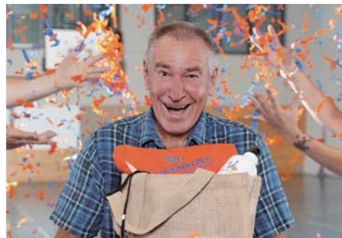
Aktion „Ehrenamt überrascht“.