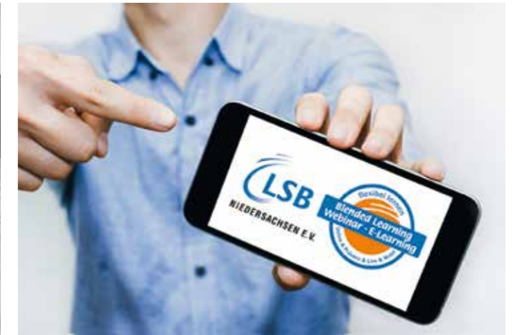
Der Online-Campus des LSB Niedersachsen

Auch am Standort Clausthal-Zellerfeld wurde das Tagesgeschäft im Jahr 2020 stark von der Corona-Krise bestimmt. Auch wenn die Zimmerauslastung inzwischen langsam ansteigt, wird sie im Jahr 2020 nicht das Niveau aus dem Vorjahr erreichen: Im Geschäftsjahr 2019 verzeichnete die Akademie einen Anstieg auf über 280 Veranstaltungen mit mehr als 14.500 Übernachtungen. Darunter auch ein Besuch des Ausschusses für Inneres und Sport des niedersächsischen Landtages und Veranstaltungen aus dem standort-eigenen Kooperationsprogramm