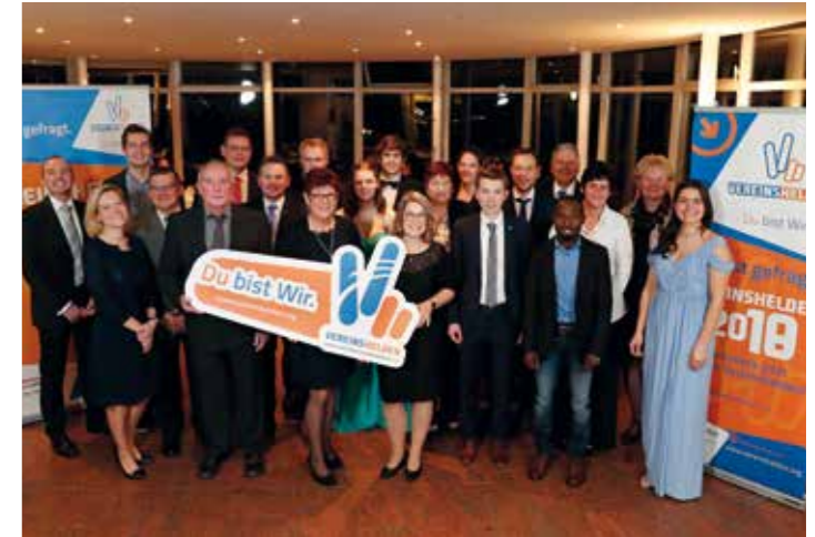
Vereinshelden beim Ball des Sports Niedersachsen.

36.000 € an Fördermitteln geflossen. Trotz der Einschränkungen durch Corona wurde dabei nahezu der Vorjahreswert erreicht. Im Bereich der Engagementförderung (Mikro- und Makroprojekte) sind die Zahlen noch rückläufig – in Halbjahr 1 wurden 45.000 € bewilligt.