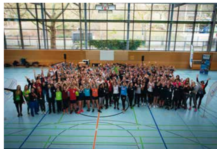
Die 130 Teilnehmenden des 2. Schulsportassisi-Days.