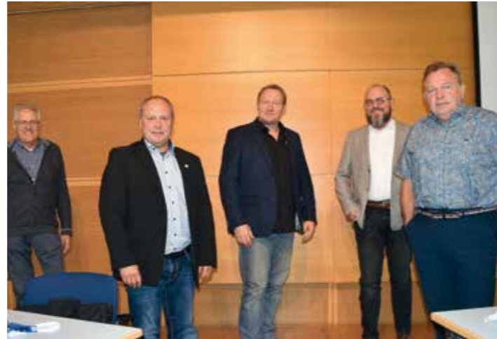
Teilnehmer der Ständigen Konferenz der Sportbünde.