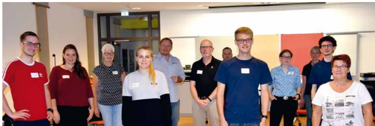
Die Arbeitsgruppe (AG) „Sportjugend Niedersachsen 2030 - Moderner Jugendverband im Sport“ hat ihre Arbeit aufgenommen.