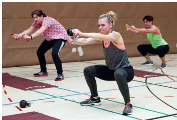
go sports Infotagung 2019.