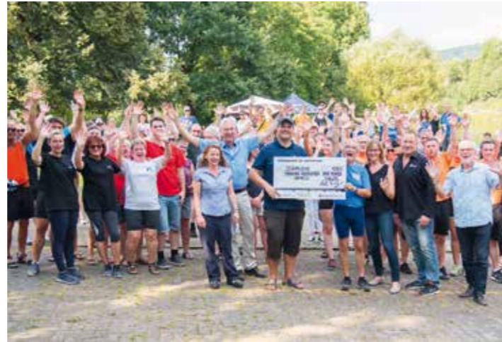
Ideenwettbewerb „Klima(s)check für Sportvereine“: Der Sieger 2019 – Mündener Ruderverein (Landkreis Göttingen-Osterode).