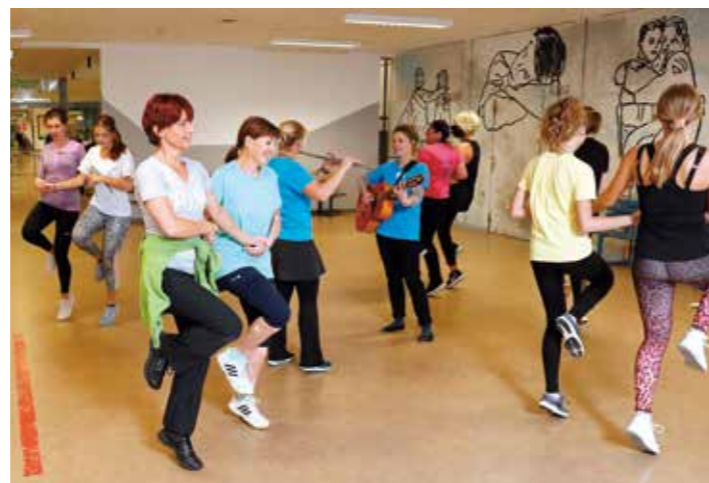
go sports Infotagung 2019.