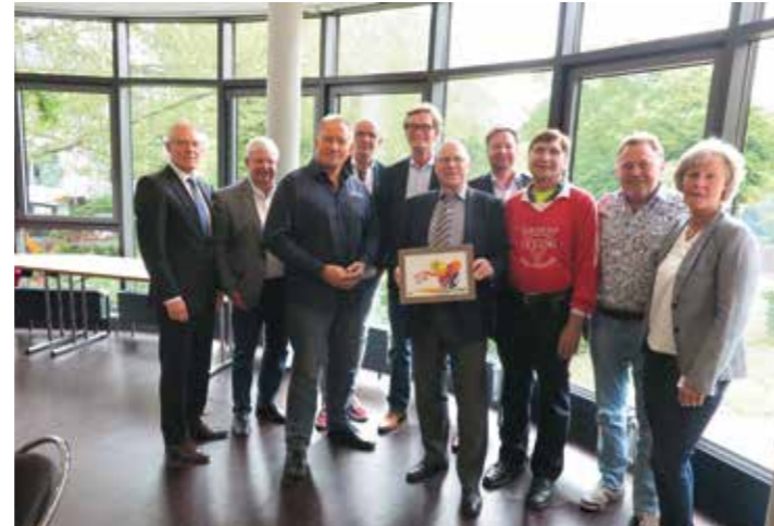
Projekt „Schritte für Frieden und Toleranz“.