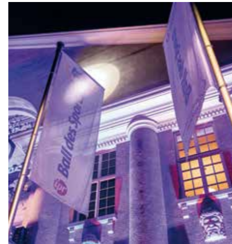
Top Veranstaltung: Ball des Sports Niedersachsen.

Eine wichtige Grundlage dafür bildeten die Ergebnisse der beiden Vereinsbefragungen, an denen insgesamt mehr als 5.000 Vereine und Verbände sich beteiligt haben. Dafür ganz herzlichen Dank! Die niedersächsische Landesregierung hat am 23. Juni beschlossen, Haushaltsmittel in Höhe von