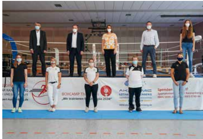
Besuch des Sportministers Boris Pistorius am Olympiastützpunkt Niedersachsen mit Athletinnen und Athleten.