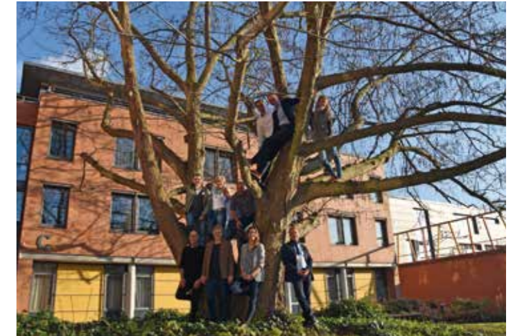
Start der Projektgruppe „LSB-Strategie 2030“ des LandesSportBundes (LSB) Niedersachsen