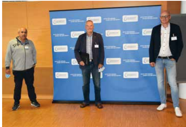
Teilnehmer der Ständigen Konferenz der LFV.