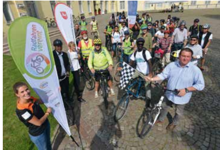
Start der Veranstaltung „Oldenburg on Tour“ auf dem Schlossplatz in Oldenburg.