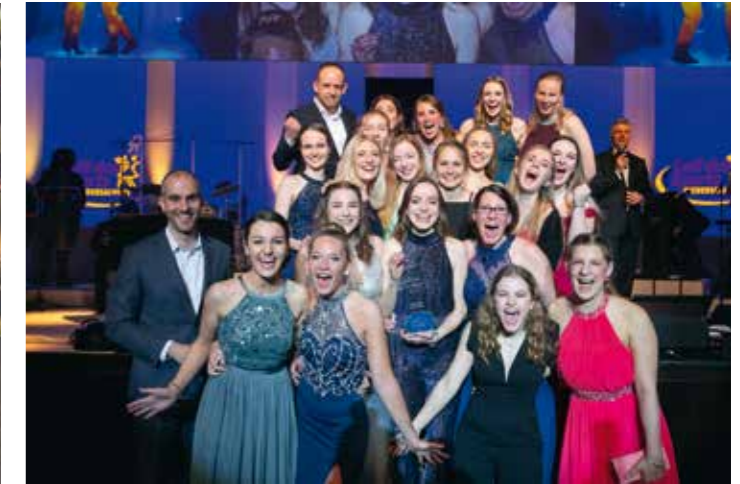
Niedersächsische Sportlerwahl 2019 : Dream Team Niedersachsen