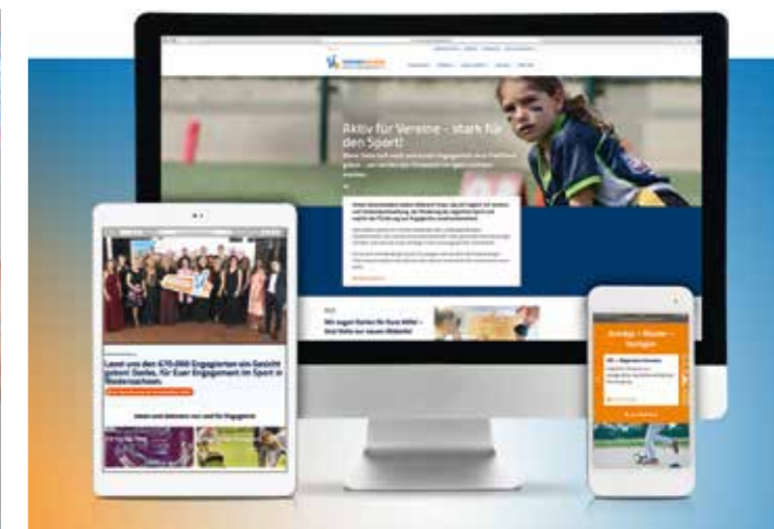
Responsives Webdesign: Die neue Vereinshelden Webseite ist für alle Endgeräte optimiert.

norarkraft unterstützt. Es fanden u. a. Workshops im Rahmen von Lehrgängen bzw. Workshop-Reihen in den Sportarten Rugby und Para-Badminton statt.