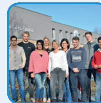
Der KSB Grafschaft Bentheim e. V.

Dieser Workshop lädt ein zu einer spannenden Reise zu sich selbst: Schauen Sie in sich hinein und finden Sie heraus, was Sie antreibt, motiviert und stärkt. Mit dem Blick auf die persönliche innere Vielfalt - das innere Team - entdecken Sie, was in Balance bringt und welche Ressourcen Sie unterstützen, wann Ihr „Engelchen“ und wann Ihr „Teufelchen“ spricht. Mit der reflexionsorientierten Methode werden Sie Ihr eigener Coach.