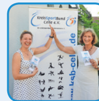
Der KSB Celle e.V.

Dieser Workshop lädt ein zu einer spannenden Reise zu sich selbst: Schauen Sie in sich hinein und finden Sie heraus, was Sie antreibt, motiviert und stärkt. Mit dem Blick auf die persönliche innere Vielfalt - das innere Team - entdecken Sie, was in Balance bringt und welche Ressourcen Sie unterstützen, wann Ihr „Engelchen“ und wann Ihr „Teufelchen“ spricht. Mit der reflexionsorientierten Methode werden Sie Ihr eigener Coach.