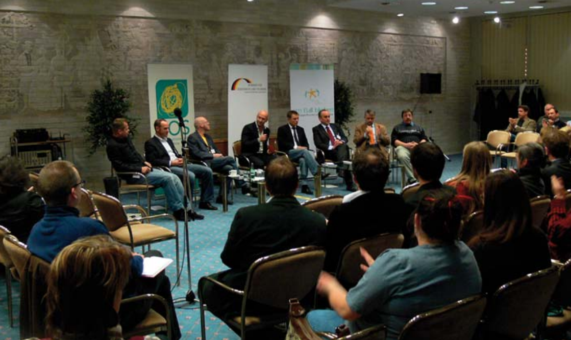
1. bundesweiter Kongress »Vereine Stark machen« in Halle/Saale